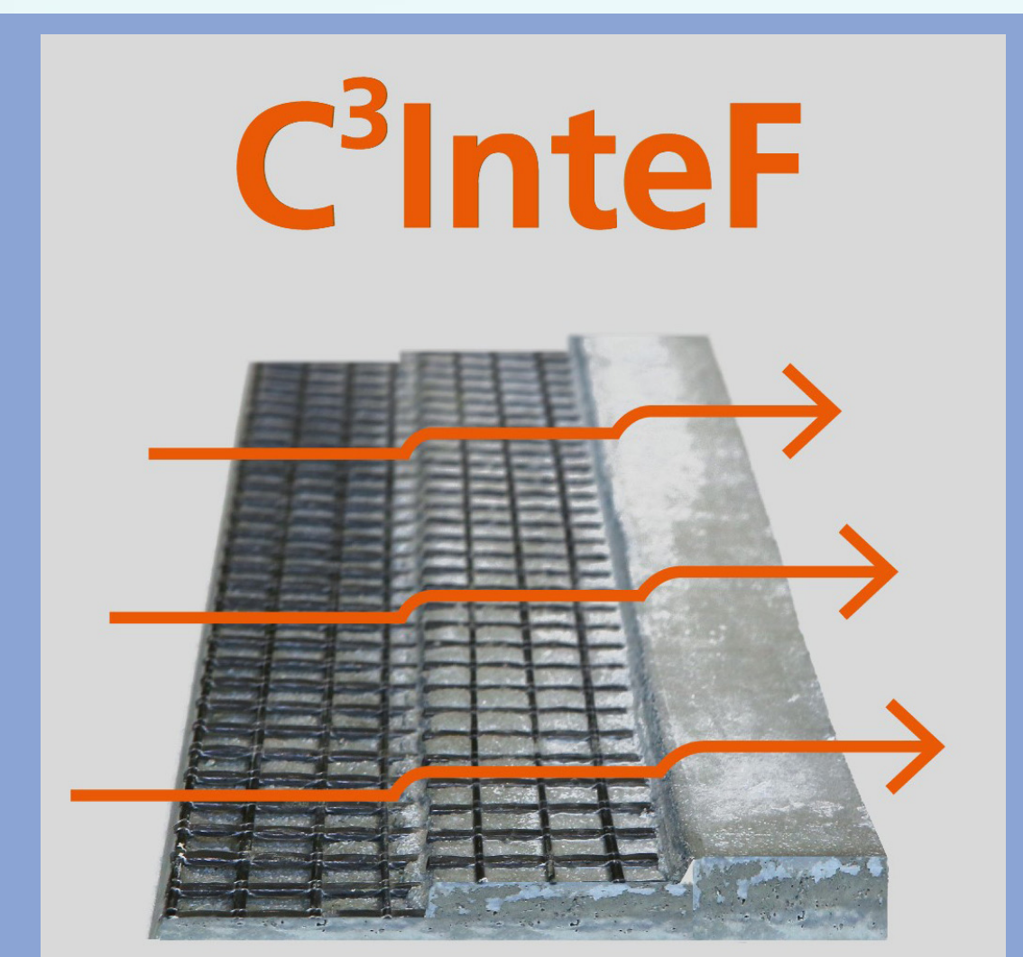
Aktivierter Carbonbeton durch Flächenheizung